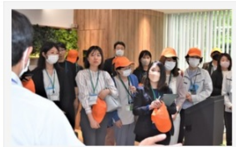
パナソニックエコシステムズ社の説明を聞く参加者

建築設備技術者協会中部支部設備女子会は5月26日、パナソニックエコシステムズ春日井本社工場を見学した。換気扇をはじめとする熱交換気機器の部品成形から組立までの一貫生産を24時間稼働で行う同工場を見学できるとあって、計25人が参加。遠方からは大阪から5人、東京から1人も駆け付けた。工場で成形工程、組立工程を見て回った他、工場内ショールームを見学、熱交換気システム、空間除菌脱臭機について理解を深めた。