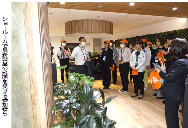
ショールームで最新製品の説明を受ける参加者ら